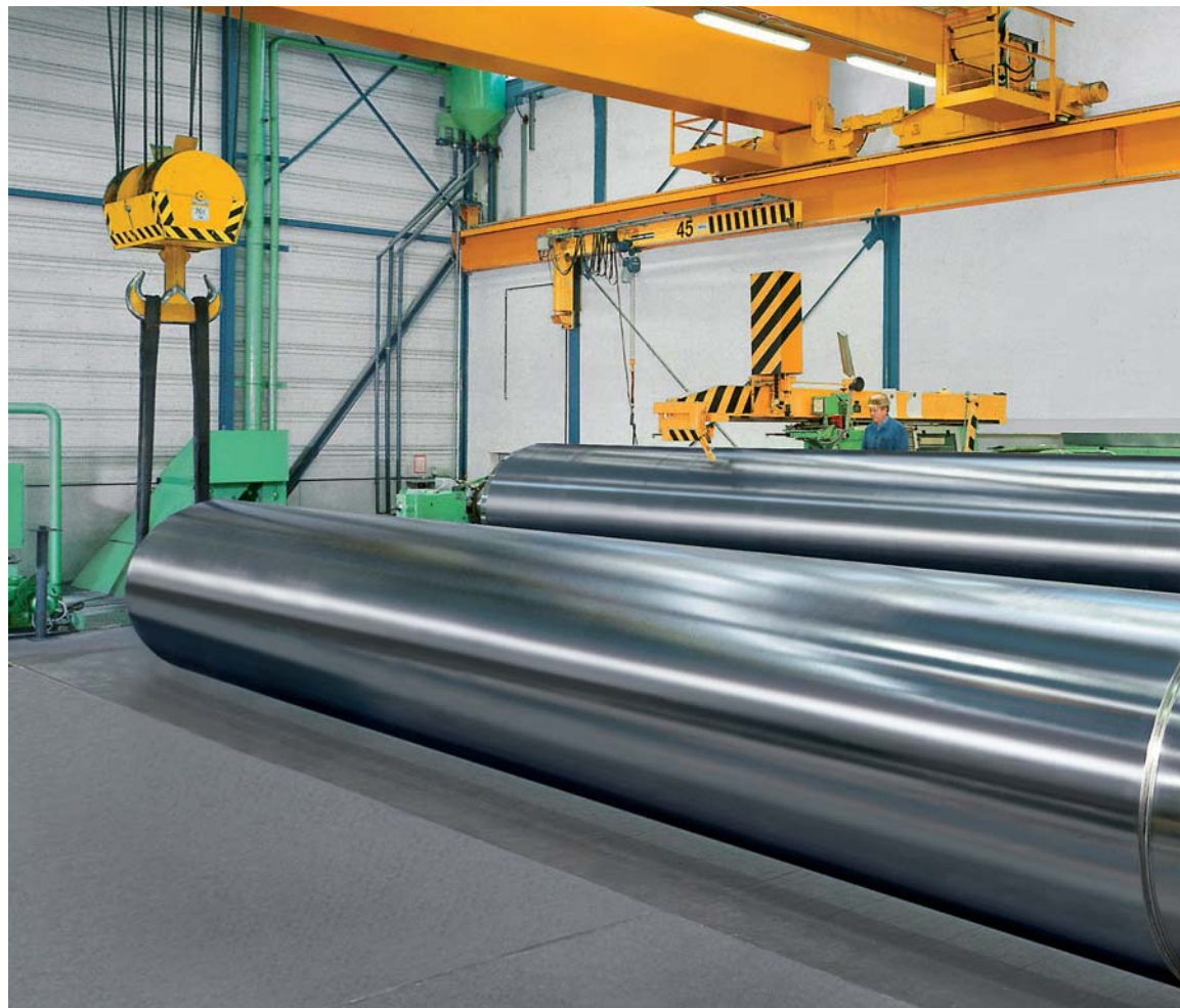
Fertig bearbeitete Kalandерwalze Durchmesser: 1.650 mm Ballenlänge: 10.770 mm Gewicht: 90 t